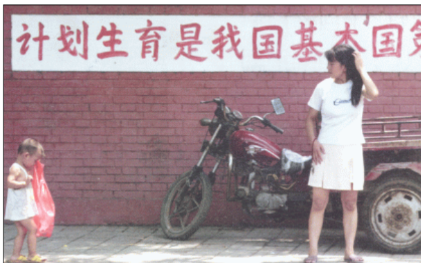
Une jeune mère chinoise regarde son enfant devant l'inscription "le contrôle des naissances est une politique de base de notre pays"

Par contre, dans le Tiers Monde, les gens meurent avant de dénoncer les abus dont ils sont victimes. Par exemple, lors des campagnes systématiques de stérilisations forcées qui ont eu lieu dans tous les pays pauvres (Afrique, Asie, Amérique Latine, du Mexique au Chili et à l'Argentine) après un accouchement dans les hôpitaux civils, si un médecin n'arrive pas à convaincre une femme de se faire stériliser, il lui met en place un ou deux stérilets à son insu. Ils pratiquent jusqu'à 30% de césariennes, parce que cela leur permet de pratiquer une ligature des trompes. Dans les "maquiladoras" ou usines en zone franche dans les pays pauvres d'Asie ou du Guatemala, qui fabriquent des vêtements, des jeans, des composants d'ordinateurs, des chaussures, etc. pour Nike, Adidas, Nestlé, Levis, et des multinationales sans scrupule, la condition d'embauche est d'avoir les trompes ligaturées ; ou bien des médecins passent sous prétexte de faire gratuitement aux jeunes ouvrières un pap-test et en profitent pour leur mettre un stérilet. En Équateur dans des ateliers de textiles et de confection, les médecins passaient auprès de chaque machine à coudre où travaillaient des femmes et leur injectaient du dépo-provera («contraceptif» abortif à effet trimestriel) en leur disant qu'il s'agissait de vitamines.