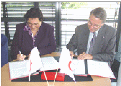
20/06/2002 : la Fédération Internationale des Sociétés de la Croix Rouge et du Croissant Rouge signe l'accord de complicité avec le FNUAP.

question ? Toujours est-il que la Croix-Rouge, en s'impliquant ainsi dans la guerre contre les populations, vient de rejeter la neutralité qui en faisait