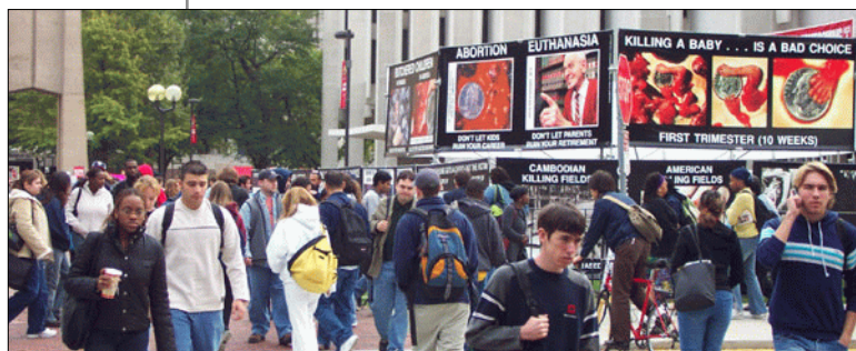
Temple University, octobre 2002. Un exemple de campagne GAP (Genocide Awareness Project) animé par le Centre de Réforme Bioéthique ( www.cbinfo.org ).

Ces tendances positives en Amérique nous concernent en Europe, où la culture de mort s'institutionnalise de plus en plus, parce que l'Amérique est un acteur majeur dans la question de l'avortement. En tant que seule grande puissance terrestre, elle exerce une très grande influence, dans un sens ou dans un autre ; ainsi depuis 40 ans, elle a soutenu les eugénistes, avec la complicité